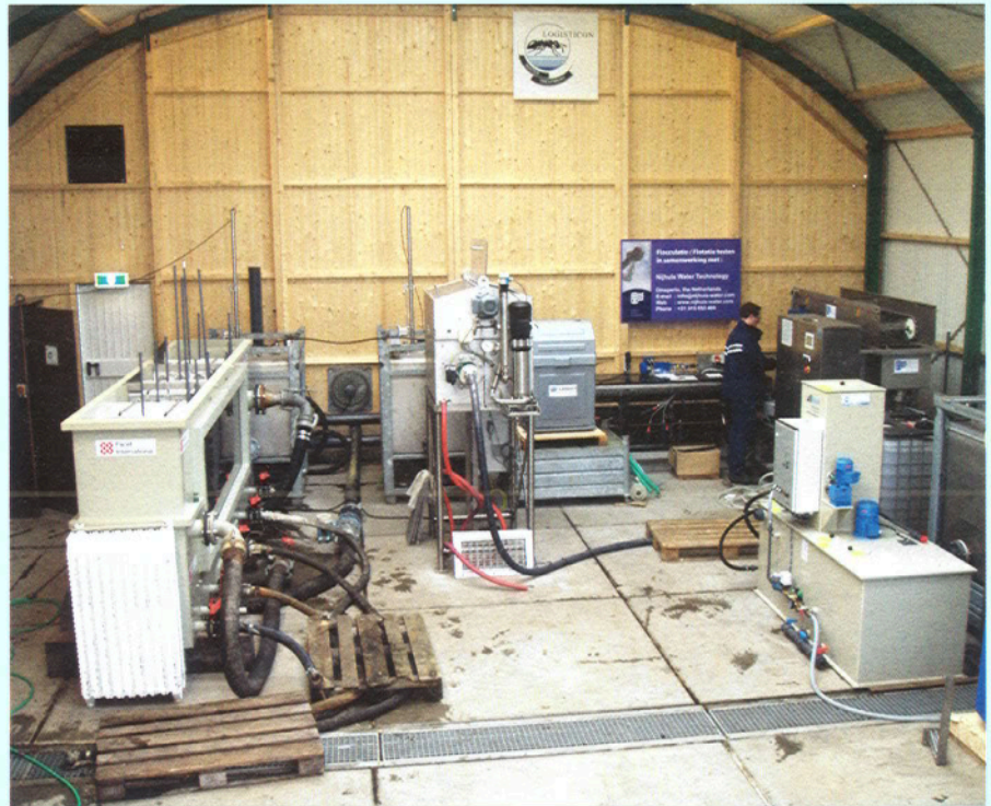
De proefhal voor het pilotonderzoek op de rwzi Eindhoven.

Op laboratoriumschaal is tevens ionenwisseling van ammonium met zeolietfilters bestudeerd. Naast de reductie van eutrofiërende stoffen als fosfaat en stikstof ligt de nadruk vooral op de verwijdering van pieklozingen van organische stoffen en ammoniumstikstof vanuit de afvalwaterketen