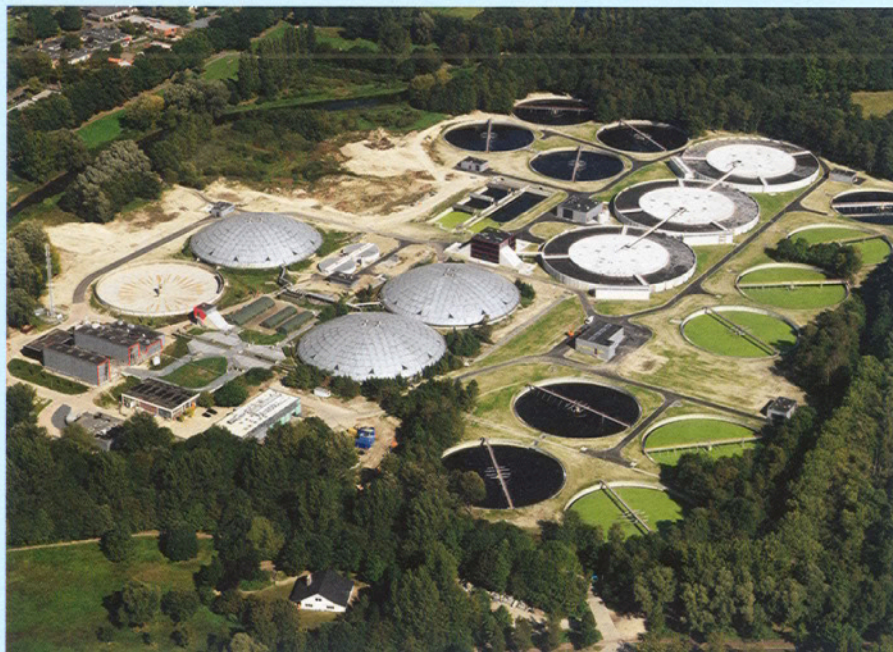
De rioolwaterzuiveringsinstallatie van Eindhoven.

Om de geschetste knelpunten te ondervangen, stonden binnen Waterschap De Dommel tal van projecten op stapel, variërend van het zoeken naar de meerwaarde van effluentpolishing, toepassing van Real Time Control gericht op minimaliseren van de emissie vanuit de overstorten tot verdere uitbreiding van de rwzi. Gezien de enorme omvang van de investeringen die aan de orde zouden zijn bij het uitvoeren van al deze plannen en